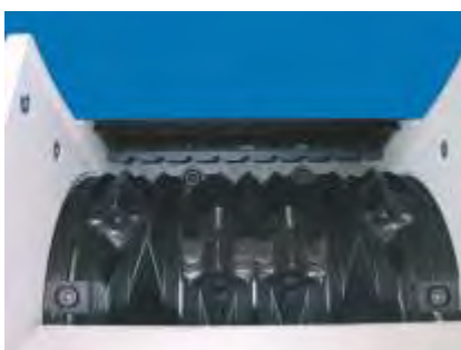
Rotor, Ø 368 mm

Vorfürungen und Versuche mit Ihrem Material sind nach Absprache in unserem Technikum möglich.