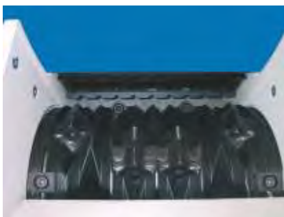
Rotor, Ø 368 mm

Vorfürungen und Versuche mit Ihrem Material sind nach Absprache in unserem Technikum möglich.